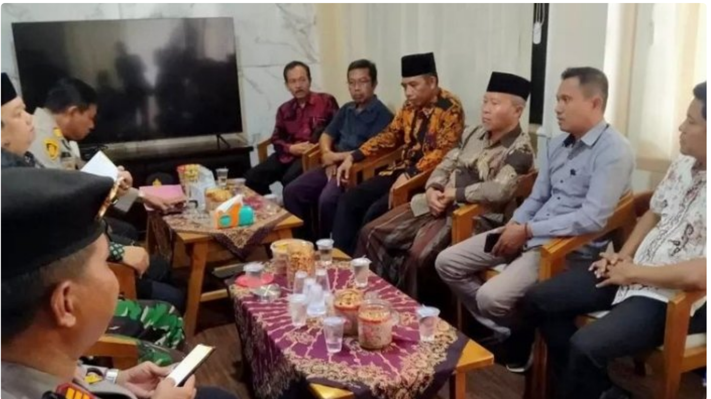
Audiensi tokoh agama yang tergabung di Aliansi Umat Islam dengan Forpimka Cluring

BANYUWANGI - Meskipun meresahkan, keberadaan toko yang menjual secara bebas minuman keras beralkohol berbagai merek yang berada di Desa Benculuk tepatnya di depan Rumah Makan Tudung Saji ini nampak aman-aman saja. Menyikapi hal tersebut, Aliansi Umat Islam Kecamatan Cluring melakukan aksi damai pencegahan maraknya peredaran minuman keras (miras) dan mempertanyakan perijinan toko tersebut.